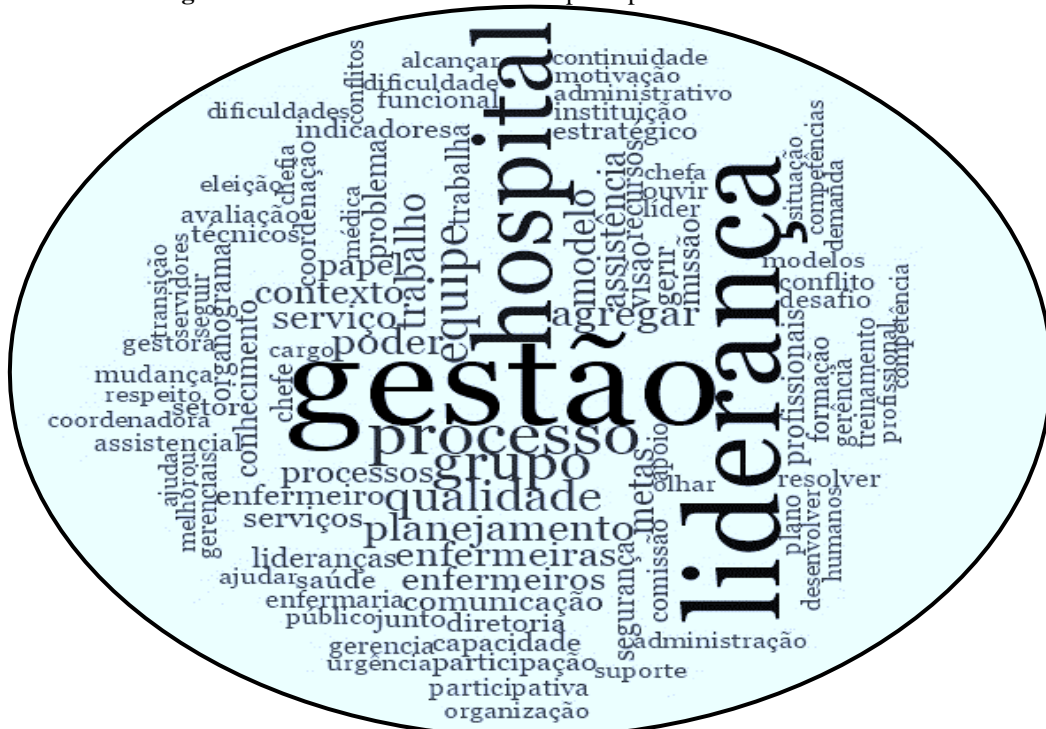
Figura 2: Nuvem de Palavras com os principais assuntos enunciados.